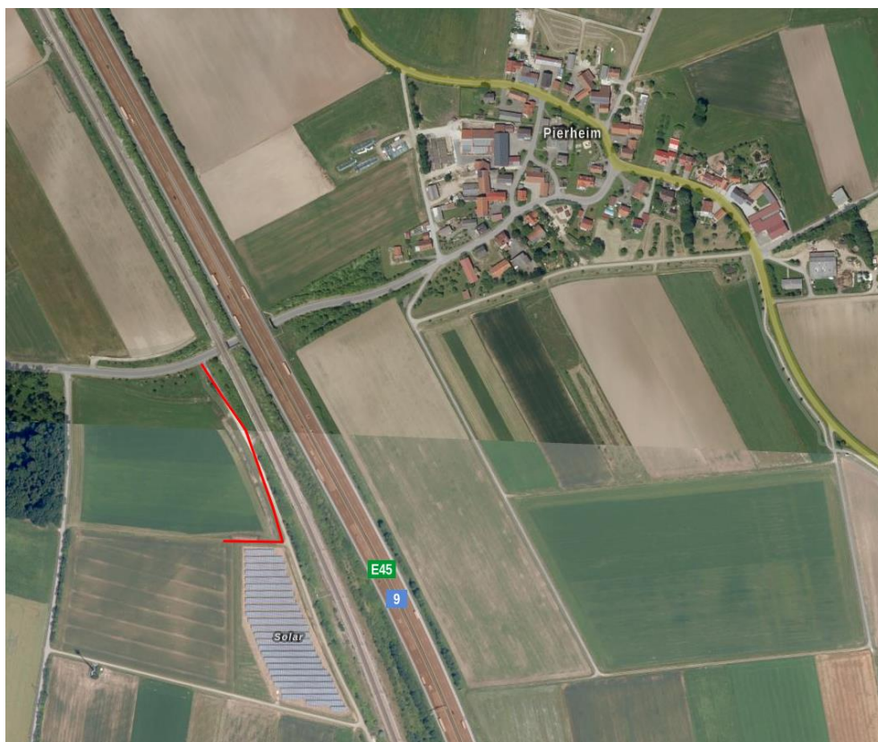
Zufahrt zum geplanten Sondergebiet

Die Erschließung des geplanten Solarparks erfolgt über die Gemeindeverbindungsstraße Grauwinkel- Pierheim von dort über den befestigten Flurbereinigungsweg nach Süden zum Geltungsbereich (siehe folgende Abbildung).